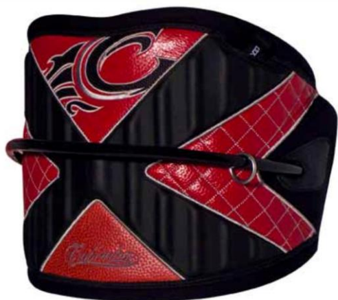
C1 FARBA ČIERNO/ČERVENÁ C2 FARBA ČIERNO/ZLATÁ